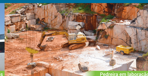
Pedreira em laboração

Agora é preciso dar mais força à CDU e garantir que sejam eleitos aqueles que melhor servem os interesses do distrito, dos trabalhadores e das suas populações.