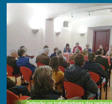
Defender os trabalhadores das pedreiras