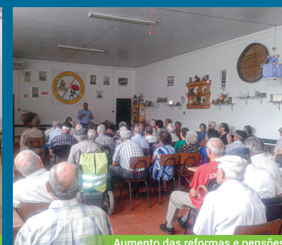
Aumento das reformas e pensões