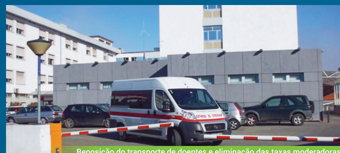
Reposição do transporte de doentes e eliminação das taxas moderadoras

A opção que cada um tem de fazer com o seu voto nas eleições do próximo dia 6 de Outubro é clara: prosseguir o caminho de avanços dando mais força à CDU ou correr o risco de voltarmos à política do empobrecimento e liquidação de direitos, com o regresso em força às opções da política de direita, seja pela mão de PSD e CDS ou do PS.