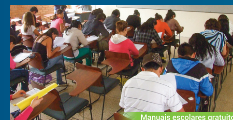
Manuais escolares gratuitos