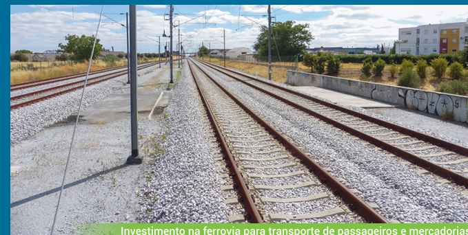
Investimento na ferrovia para transporte de passageiros e mercadorias