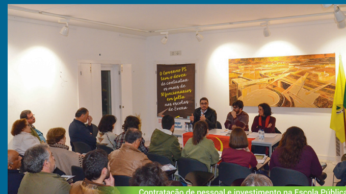
Contratação de pessoal e investimento na Escola Pública

A voz da CDU foi a voz dos trabalhadores e das populações do distrito na Assembleia da República e a nossa luta foi a luta do distrito pelo seu desenvolvimento.