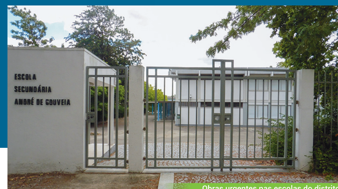
Obras urgentes nas escolas do distrito

Realizámos um trabalho ímpar pelo distrito e suas populações, em defesa: