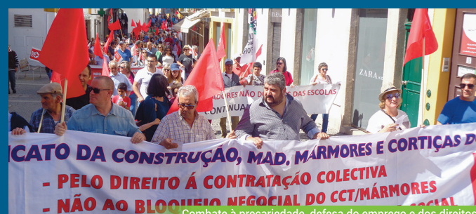
Combate à precariedade, defesa do emprego e dos direitos