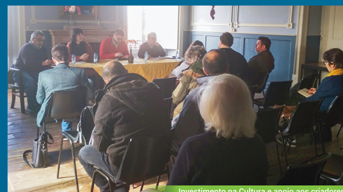
Investimento na Cultura e apoio aos criadores