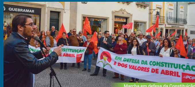
Marcha em defesa da Constituição