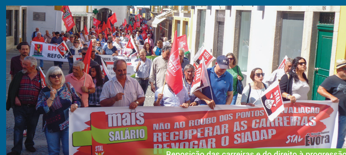
Reposição das carreiras e do direito à progressão

A opção que cada um tem de fazer com o seu voto nas eleições do próximo dia 6 de Outubro é clara: prosseguir o caminho de avanços dando mais força à CDU ou correr o risco de voltarmos à política do empobrecimento e liquidação de direitos, com o regresso em força às opções da política de direita, seja pela mão de PSD e CDS ou do PS.