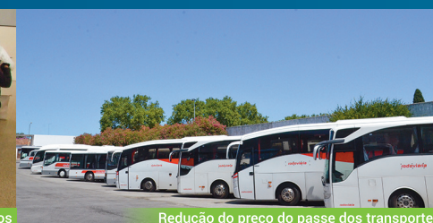
Redução do preço do passe dos transportes